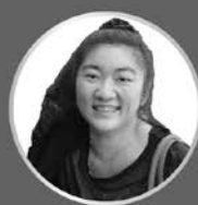
侯律 民事訴訟法概要