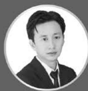
黎律 刑事訴訟法概要