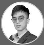
陳熙哲 行政法概要