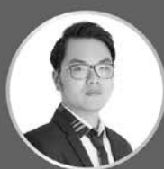
劉律 刑法/刑訴概要