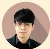
韓律(康皓智) 行政法