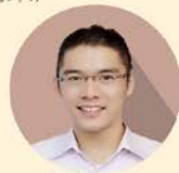
金乃傑(魏取向) 資通安全